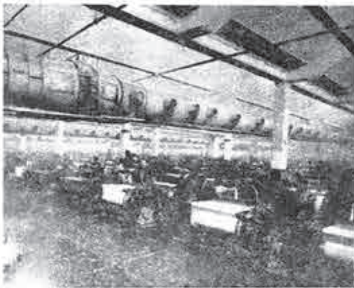
عکس فوق نمای قسمتی از ماشین آلات بافندگی است